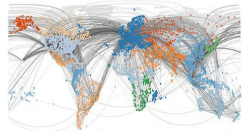
Quelle: Risikoabschätzung des Imports von Ebola durch das weltweite Flugnetz Prof. Brockmann/Robert Koch-Institut; Humboldt-Universität zu Berlin

Der Luftverkehr ist einer der Wirtschaftssektoren, die von den Maßnahmen zur Eindämmung der Pandemie hart getroffen werden. Entsprechend fordern die dort aktiven Konzerne und Lobbygruppen lautstark nach staatlicher Hilfe. Man muss aber das ganze Bild betrachten. Denn der Luftverkehr ist mindestens ebenso sehr Täter wie Opfer. Er spielt eine wesentliche Rolle bei der schnellen globalen Ausbreitung des Coronavirus, hat aber keinerlei Vorbereitung dafür getroffen.